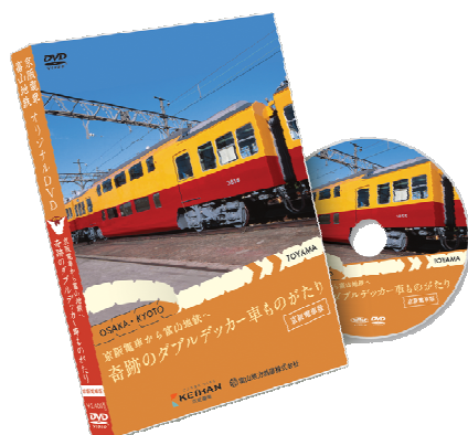
京阪電車版パッケージ