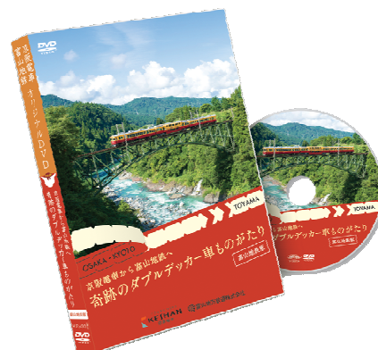
富山地鉄版パッケージ