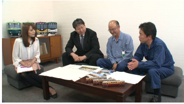
京阪関係者が語る ダブルデッカー開発秘話