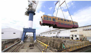
新天地 富山への旅立ち (輸送風景)