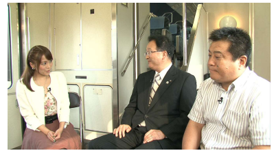
富山地方鉄道関係者が語る ダブルデッカーへの思い