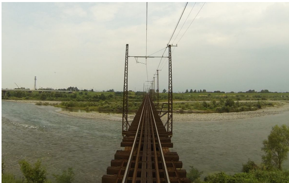
ダブルデッカーエクスプレス 特急うなづき5号 ノーカット展望映像 (電鉄富山→宇奈月温泉)