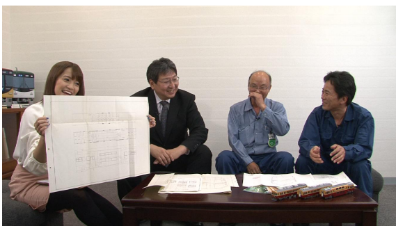
幻のロングシート図面ほか、 京阪関係者が初めて明かすエピソード集