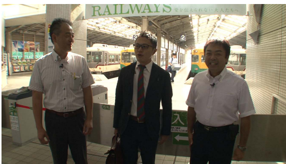
ホリプロ南田マネージャーと行く！ 富山地方鉄道の旅