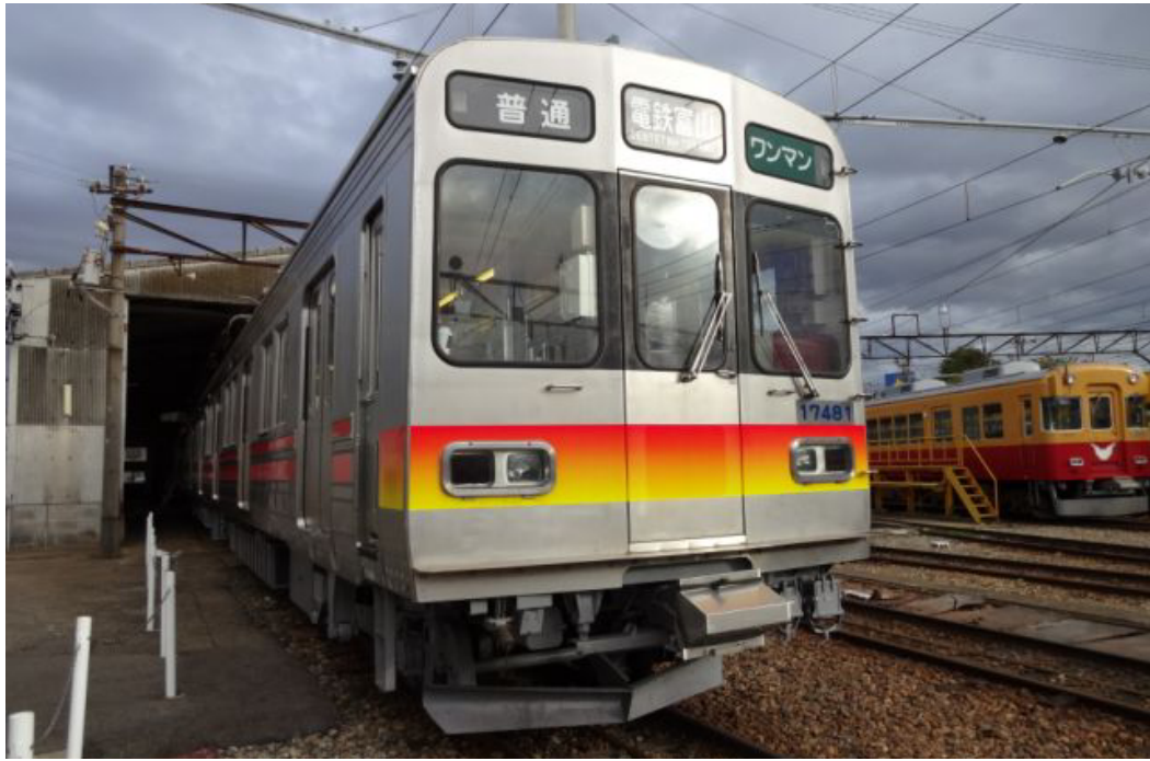
オールステンレス車輈 モハ17480形