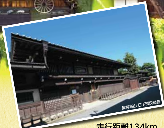
飛騨高山 白川郷 白川郷 飛騨高山 白川郷 飛騨高山 白川郷