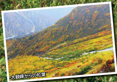
大観峰からの紅葉