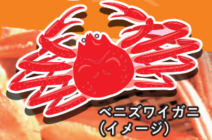
ベニズワイガニ (イメージ)